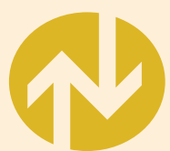
昇降機等 定期検査報告マーク